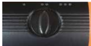
3 Sebességu váltó