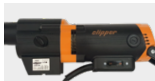
Alumínium test, javított hőelosztás