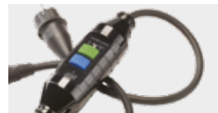
PRCD hibaáram védelem 230 V 16 A - 10 mA