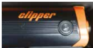
Könnyű hozzáférés a szénkeféhez