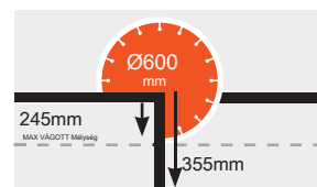
Max vágási mélység