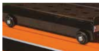
Surlódásbiztos döntött görgők