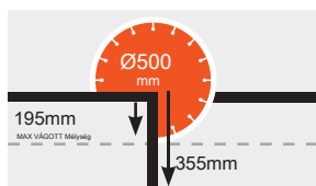
Max vágási mélység