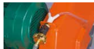
Víztömlő csatlakozó (csak CS451 E)