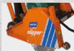
CS451 ET Vágókorongvédő