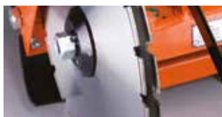
Ikerlapát felszerelése (csak CS451 E)