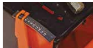
Vágási mélység mutató