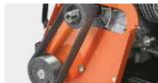
Könnyen cserélhető szíjtárcsa és ékszíj