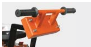
Alacsony rezgésű kormány