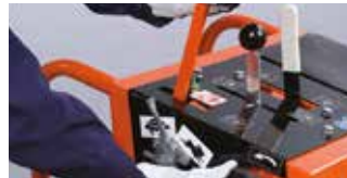
Kézi / Hidraulikus vágókorong mozgató