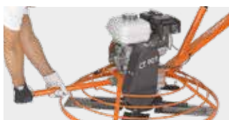
A gép kezelése