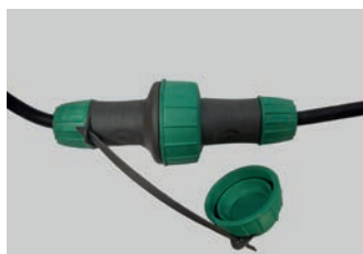
EASY VÍZSZIVATTYÚ DUGÓ