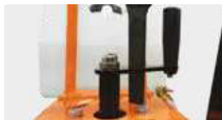
EGYSZERŰ VÁGÁSI MÉLYSÉG BEÁLLÍTÁSA KÉZIKERÉKKEL