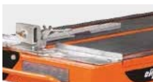
Vágási útmutató tartalmazza