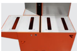
Asztal görgő nélkül (70184603243)