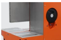
AZ INTEGRÁLT KERÉKKERÉK