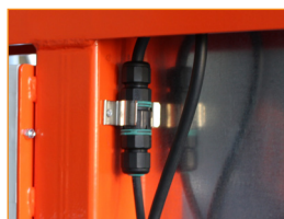
KÖNNYEN csatlakoztatható VÍZVIVATTYÚ