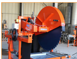
900 és 1000 mm-es átmérőjű tárcsákhoz